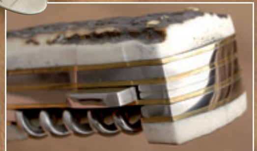
Sauberes Finish: Alle Kanten sind bündig, nirgends fallen unschöne Spalte auf.