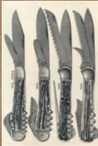
Klassiker: Jagd-Klappmesser in einem Dreizack-Katalog von 1904.

Von den meisten Modellen in unserer Übersicht gibt es weitere Varianten ohne Korkenzieher. Von einigen sind auch andere Größen lieferbar. Sie haben also die Wahl. <