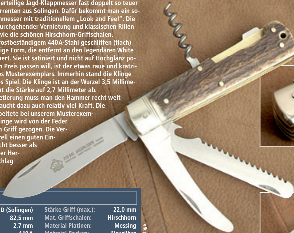
Schönheitsfehler: Schief geschliffene Zierrillen an einem der beiden Backen.

Zum Lösen der Arretierung muss man den Hammer recht weit hineindrücken, man braucht dazu auch relativ viel Kraft. Die Verriegelung selbst arbeitete bei unserem Musterexemplar zuverlässig. Die Klinge wird von der Feder auch vollständig in den Griff gezogen. Die Verarbeitung macht generell einen guten Eindruck, ist aber auch nicht besser als bei den übrigen Solinger Herstellern. Der Preisaufschlag ist daher nicht ganz nachzuvollziehen.