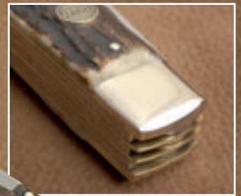
Exakte Arbeit: Die Backen und Griffschalen sind perfekt an die Platinen angepasst.