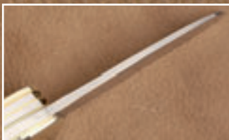
Solide dimensioniert: Die Klinge ist am Ansatz volle vier Millimeter stark und verjüngt sich dann.

Auch die übrigen Teile geben keinen Anlass zur Kritik. Die Säge zeigt eine Besonderheit: Neben dem Kapselheber am Ansatz besitzt sie am Ende eine runde Aussparung, die als Schrotpatronen-Löser dient. Alle Werkzeuge lassen sich nicht überleicht, aber ohne zu großen Kraftaufwand ausklappen. Die Verarbeitung ist top, das Messer wirkt solide wie ein Fels. Da ist der Preis wirklich nicht zu hoch angesetzt!