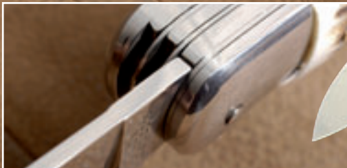
Zu viel Spiel: Bei ausgeklappter Klinge bleibt ein wenig Luft zwischen Klingenswurzel und dem Hammer der Arretierung.