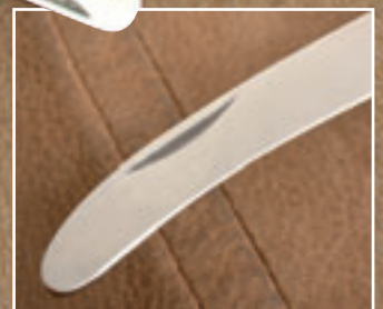
Simpel gelöst: Die Waidklinge ist vorne nur stumpf, aber nicht verdickt wie bei den Konkurrenten.