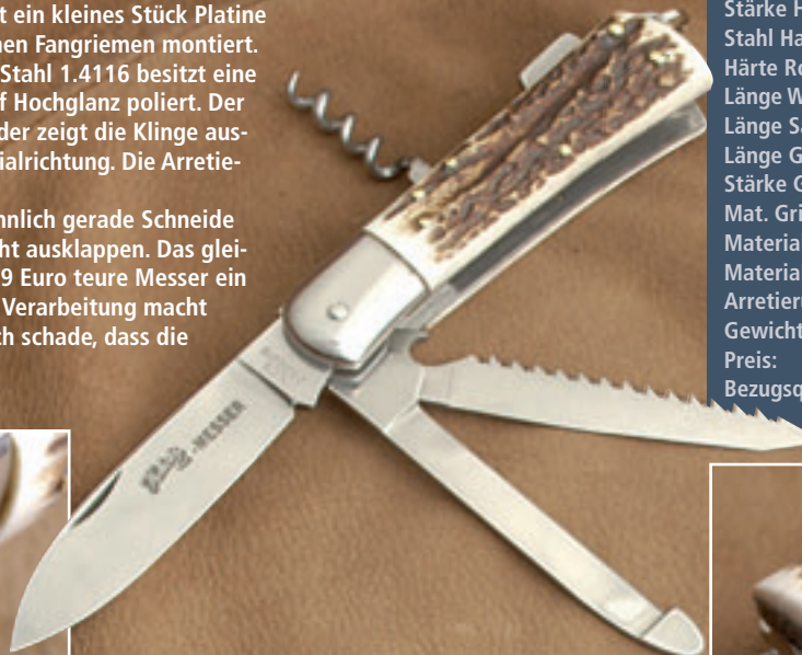
Praktisch: An der verlängerten Platine ist eine bewegliche Öse montiert.