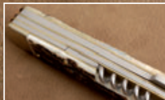
Erstklassig: Das Hubertus-Messer zeigt beste Verarbeitungsqualität „made in Solingen“.