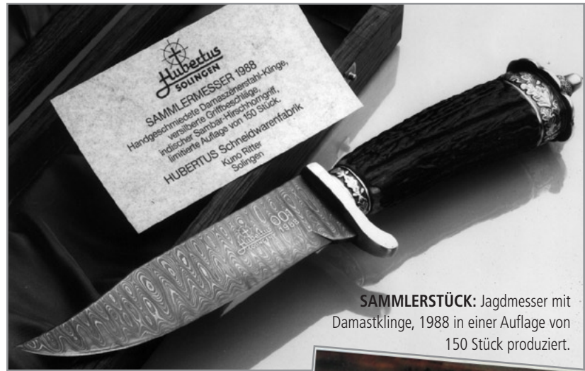
SAMMLERSTÜCK: Jagdmesser mit Damastklinge, 1988 in einer Auflage von 150 Stück produziert.