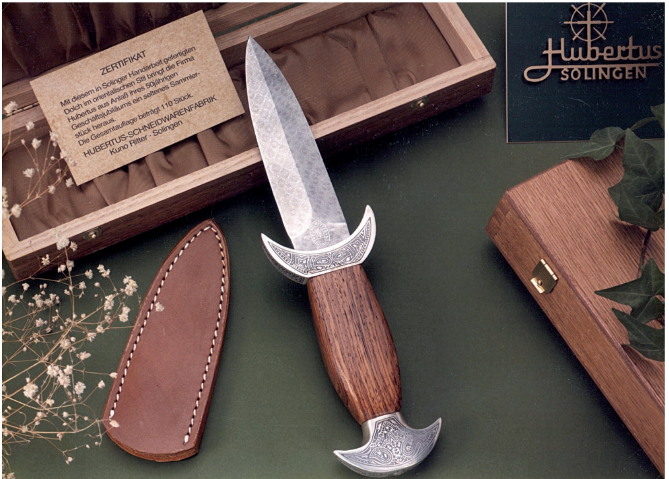
JUBILÄUMSMODELL: Dolch im orientalischen Stil, 1982 in kleiner Auflage produziert.